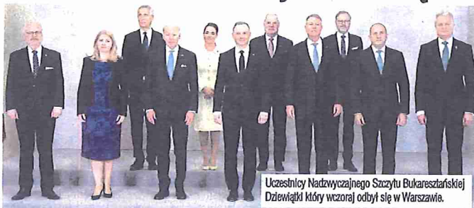
Uczestnicy Nadzwyczajnego Szczytu Bukaresztańskiej Dziewiątki który wczoraj odbył się w Warszawie.